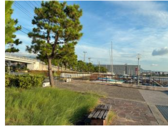
北折り返しへ向かう