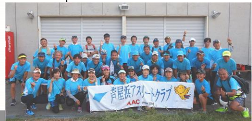
芦屋浜アスリートクラブのボランティアスタッフ