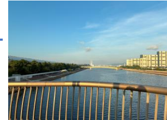
涼風大橋からゴール方向